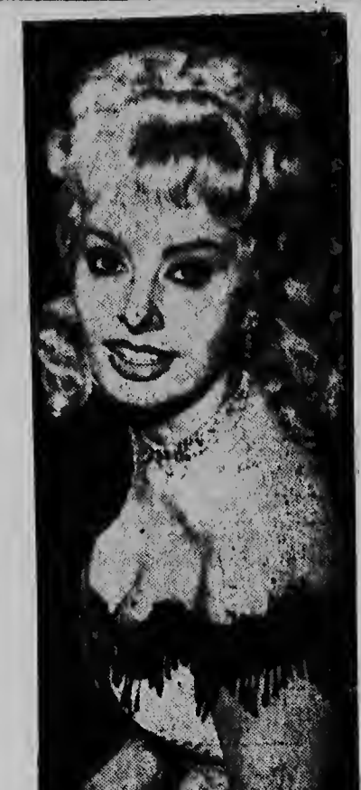
TA KENDE? — Wel, ta e brunet, e actriz bon conoci Italiano Sophia Loren. Aki Sophia ta un blondina, trahando den „Heller With A Gun“ na Hollywood, su prome pelicula di West, su prome rol como blondina cu eia haci te awor.

MEXICO, 8/3. — Den region di Monterrey (parti septentrional di Mexico) a muri 25 hende y a perde nan bista 30 otro despues di a bebe alcohol metilico (alcohol denaturaliza) koe a worde horta for di un cantidad di 5.000 liter koe tabata den algun camion di-parker. Na hospitalnan tin hopi victima mas den estado critico.